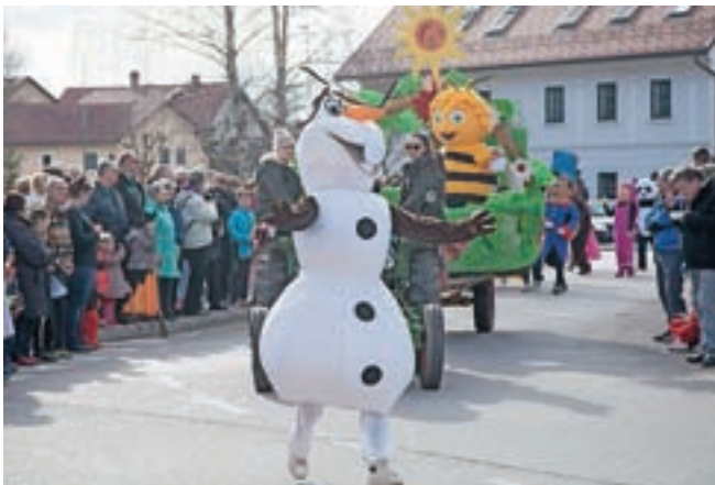
Manjkali niso niti risani junaki.