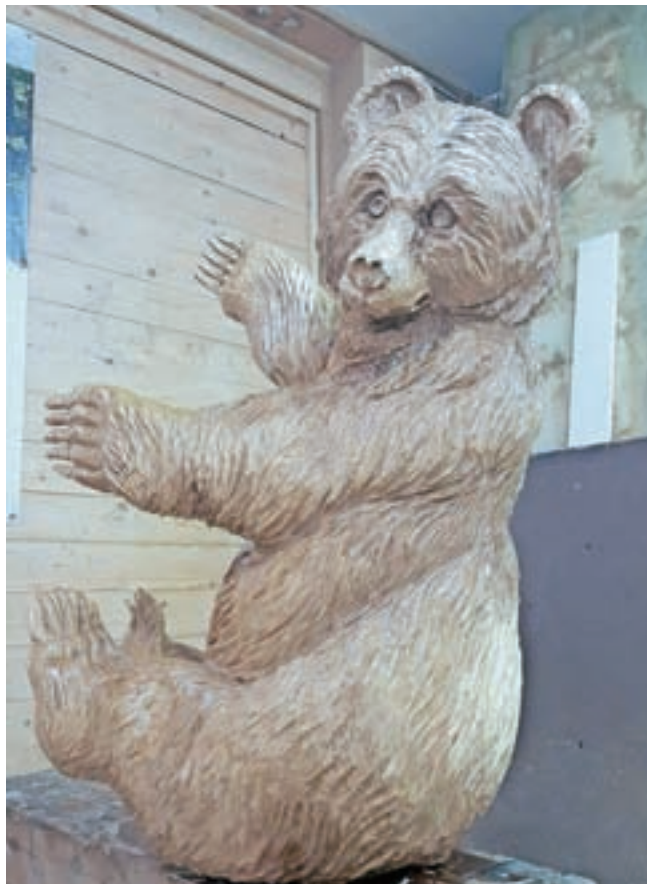
Medved, ki je nastal pod rokami cerkljanskega rezbarja